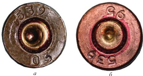
След бояка пистолета-пулемета «Борз» (а) и пистолета-пулемета «Кедр» (б)

Автоматическая винтовка, или автомат – основной вид индивидуального стрелкового оружия. По параметрам надежности, оптимальному соотношению эксплуатационных и боевых качеств отечественный автомат АК-74 является в настоящее время лучшим в мире. По мнению специалистов, в том числе западных, до 2020–2025 гг. в мире не появится оружие лучше, чем автомат М. Т. Калашникова. Тем не менее наше оборонное ведомство прекращает закупки этого оружия. Однако, даже если речь пойдет о переходе на натовские стандарты, отказываться от автомата Калашникова не имеет смысла, поскольку есть автоматы серий «100» и «200» под натовские патроны. Кроме этого, в некоторых странах весьма эффективно используются винтовки, представляющие собой копии автомата Калашникова, например израильская винтовка «Галил».