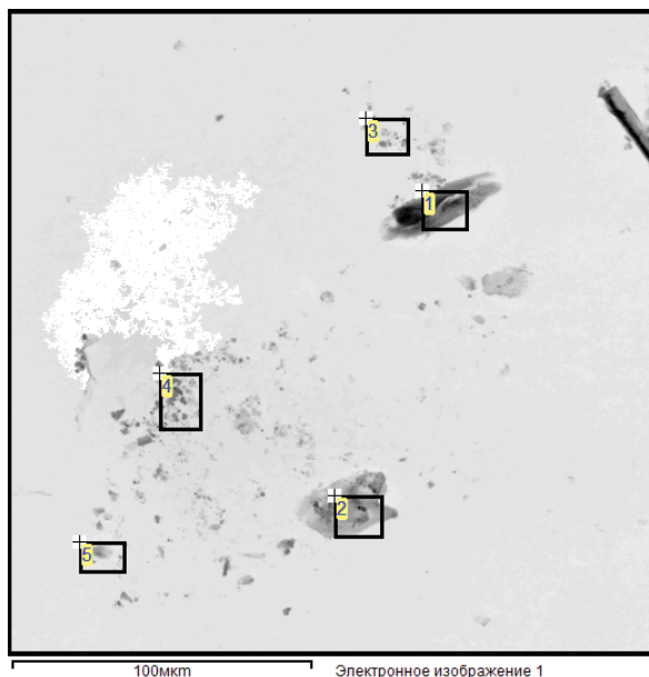
Рис. 1. Частицы продуктов выстрела, изъятые с преграды в месте соударения гильзы со стеной, покрашенной черным лаком

Микроскопические исследования морфологии поверхности микрочастиц образцов проведены во вторичных электронах. На рис. 1 представлены характерный вид и размеры частиц продуктов выстрела, изъятых с преграды в месте соударения гильзы со стеной, на рис. 2 – частицы внешнего покрытия с преграды на стреляной гильзе.